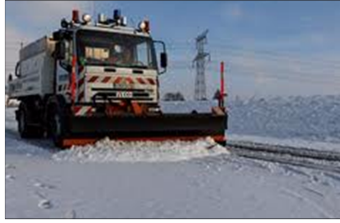
Plan de déneigement du département de l'Aube